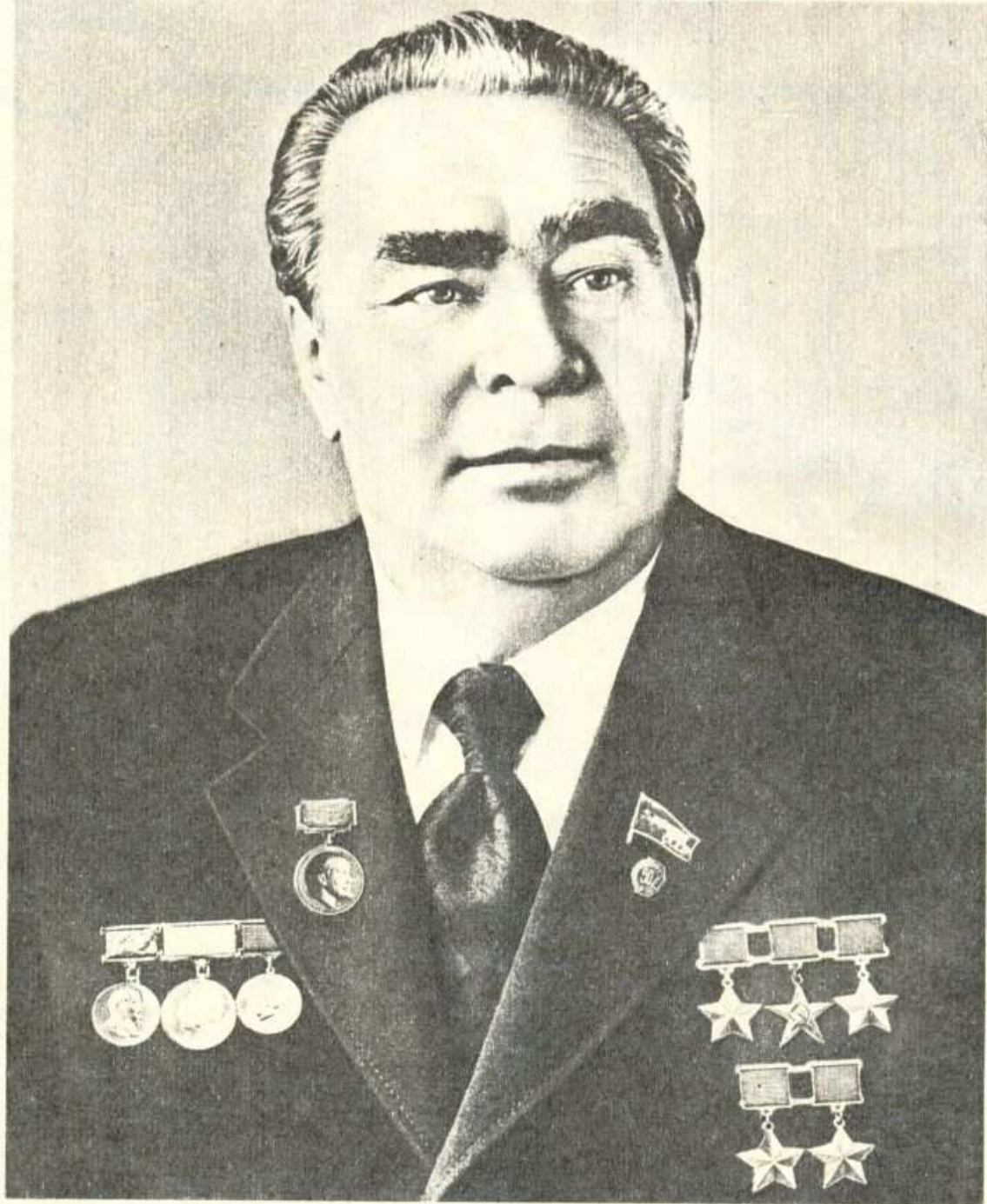
Leonidas Brežnevas (1906—1982)

TSKP CENTRO KOMITETO, TSRS AUKŠČIAUSIOSIOS TARYBOS PREZIDIUMO, TSRS MINISTRŲ TARYBOS