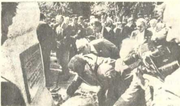
Gėlės prie paminklinio akmens.

riai, geriausi sportininkai ir treneriai, respublikos aviacijos sporto klubų darbuotojai, šio sporto aktyvistai ir visuomenininkai.