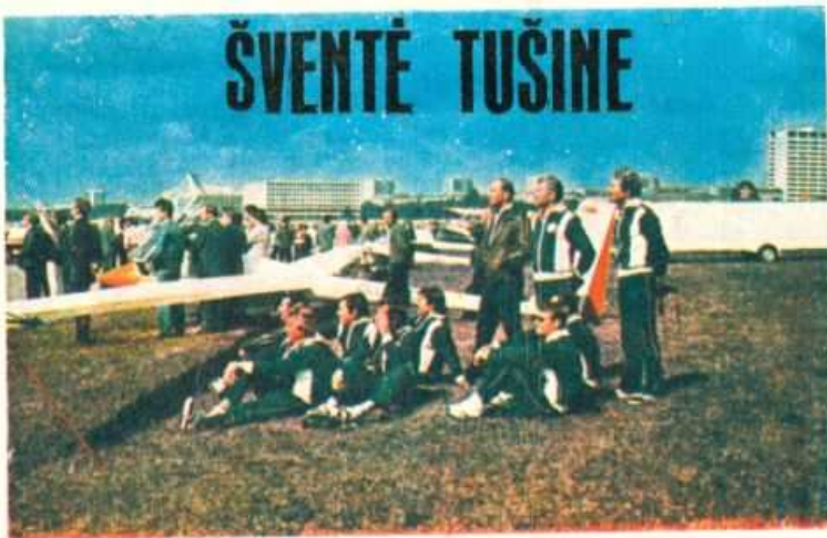
Tarybų Lietuvos sportininkai šventės Tušine dalyviai.

Kasmet, pažymint TSRS Oro laivyno dieną, Maskvos Tušino aerodrome rengiama aviacijos sporto šventė. Šiais metais šventėje drąsą ir sportinį meistriškumą, vyriškumą ir pasiruošimą Tėvynės gynybai demonstravo Lenino ir Raudonosios vėliavos ordinais apdovanotos Savanoriškos draugijos armijai, aviacijai ir laivynui remti sportininkai. Jie