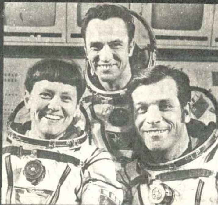
Iš kairės: S. Savickaja, L. Popovas ir A. Serebrovas.

ėjo visą ruošimosi skridimams laivu „Sojuz T“ ir orbitinė stotimi „Saliut“ kursą.