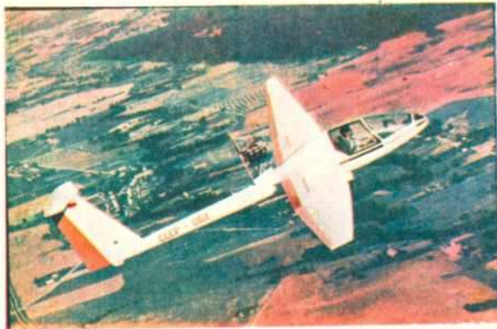
Prienų eksperimentinėje sportinės aviacijos gamykloje pastatytas motosklandytuvus „Nemunas“ buvo viena įdomiausių aviacijos šventės Tušine naujovių.

Aukšto įvertinimo susilaukė šventėje savo meistriškumą demonstravę Tarybų Lietuvos sklandytojai. Grupė mūsų sklandymo meistrų sklandytu-